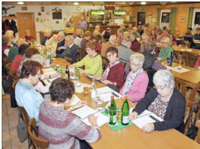
Gemeinschaftliches Singen beim Hüttenabend-Hüttenzauber am 12.01.2018

wobei das erste Lied: „Marina, Marina ...“ unseren Geburtstagskinder -die seit dem letzten Hüttenzauber ihren Geburtstag hatten- zelebrierte wurde. Kurz vor 19.30 Uhr wurden zum Abschluss das Lied: „Ade zur guten Nacht ...“ als letztes von insgesamt 18 Liedern an diesem Abend gesungen.