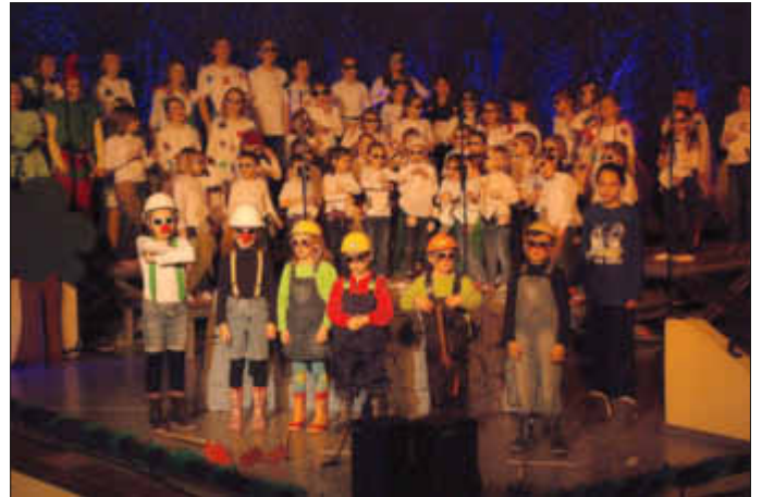
Die Kinder bei der Premiere in Forchheim

Wir würden uns sehr freuen, wenn wir euch am 03.03. um 15.00 Uhr, zu unserer Vorstellung begrüßen können.